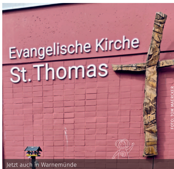
Jetzt auch in Warnemünde

nen kleinen Festgottesdienst veranstalten. Außerdem können Sie sich den Kirchraum beim Johannisfeuer am 16. Juni ab 17 Uhr anschauen. Fühlen Sie sich zu beiden Veranstaltungen herzlich eingeladen. | Katrin Wündisch