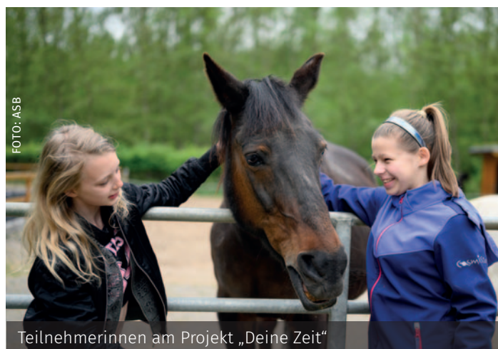
Teilnehmerinnen am Projekt „Deine Zeit“