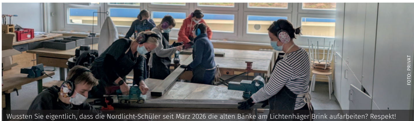
Wussten Sie eigentlich, dass die Nordlicht-Schüler seit März 2026 die alten Bänke am Lichtenhäger Brink aufarbeiten? Respekt!

gibt auch einige jüngere Mitstreiterinnen und Mitstreiter. Und natürlich braucht so ein Cafébetrieb auch eine gründliche Planung. Und so treffen wir uns immer am ersten Montag des Monats zum sogenannten MORGA-Treffen im Stadtteilbüro, um den Plan für den nächsten Monat zu entwickeln. Jeden Freitag sind dann fünf Personen im Einsatz, jede mit einer festen Aufgabe, in entspannter Atmosphäre und herzlichem Austausch. Denn wir alle sind hier ehrenamtlich tätig, deshalb ist es umso wichtiger, dass sich jede und jeder im Team wohlfühlt und gerne dabei ist. Wir möchten uns an dieser Stelle bei allen bedanken, die uns in diesen zwei Jahren unterstützt haben, ebenso wie bei unseren Gästen. Und freuen uns auch im nächsten Jahr über jede Besucherin und jeden Besucher, immer freitags ab 14 Uhr im Stadtteil Büro Lichtenhagen Am Brink 10. | Manfred Bunge