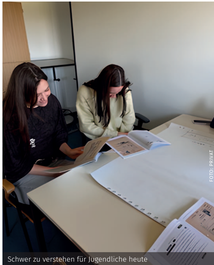
Schwer zu verstehen für Jugendliche heute

Durch die echten Fälle wurden Begriffe wie „Überwachung“ und „Unterdrückung“ greifbar. Für die Schülerinnen und Schüler war der Besuch nicht nur eine Geschichtsstunde, sondern auch eine wichtige Erinnerung daran, wie wertvoll Freiheit und Grundrechte sind. | Claudia Ahrens