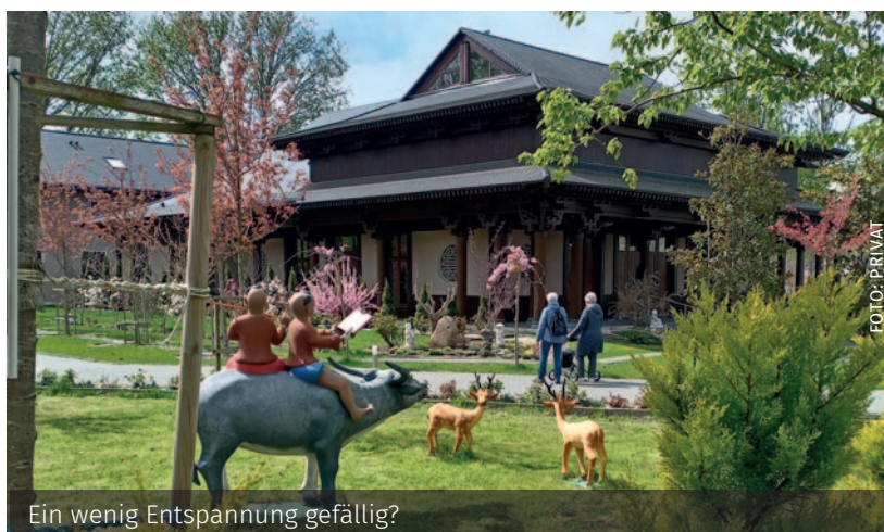
Ein wenig Entspannung gefällig?

26 26.09.2026, 11 bis 17 Uhr . Stadtteilfest auf dem Lichtenhäger Brink